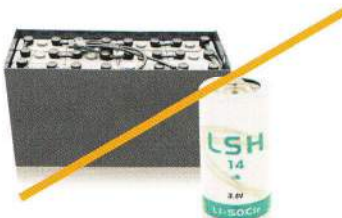
Piles et batteries industrielles