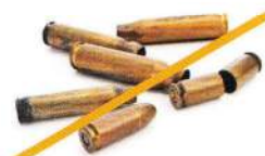
Cartouches ou douilles de fusil