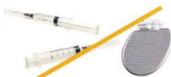
Seringues ou pacemaker