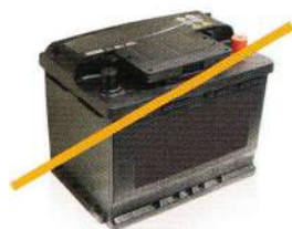
Batteries au plomb et à l'acide (batterie de voiture ou de moto)