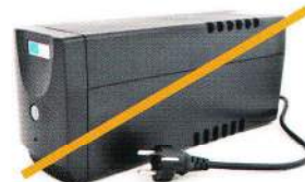
Onduleur (nous prenons uniquement la batterie)

➔ En cas de doute, n'hésitez pas à envoyer des photos à Corepile.